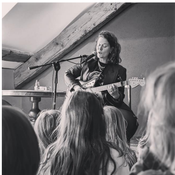
Concert de Billie Bird

Il nous faut également partager les locaux pour l'organisation de certains événements et en novembre, à l'occasion de la Nuit du conte, nous avons pour la première fois testé l'organisation de contes dans la salle de jeux des 3-4P au premier étage du bâtiment.