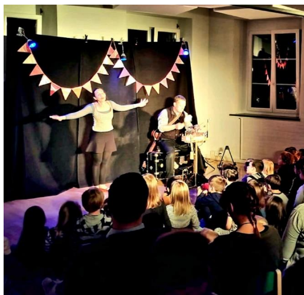
Nuit du conte